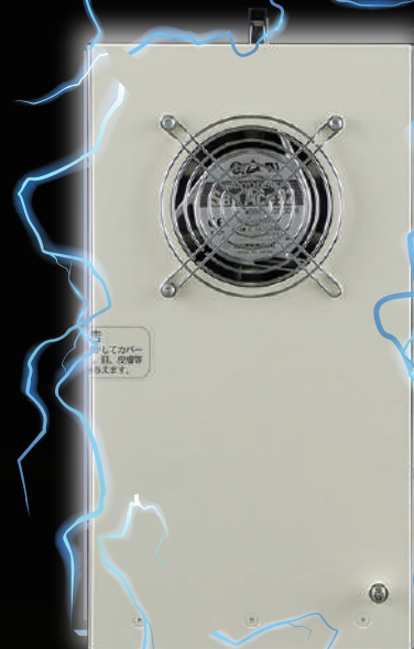
Lightning Guard イナズマガード